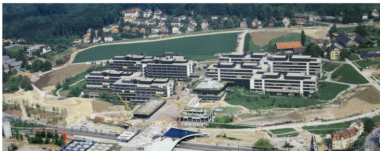
L'extension partielle de l'Université de Zurich sur le Strickhofareal, dans les années 1970, compte parmi les projets de construction majeurs soutenus par la Confédération sur la base de l'ancienne loi sur l'aide aux universités. Le campus Irchel de l'Université de Zurich a été bâti où se trouvait l'école d'agriculture Strickhof.

Dossier «Contributions d'investissements et participation aux frais locatifs» (comportant les bases légales, les formulaires, etc.) 🌐 www.sbfi.admin.ch/beitraege_uvfgh_fhsg