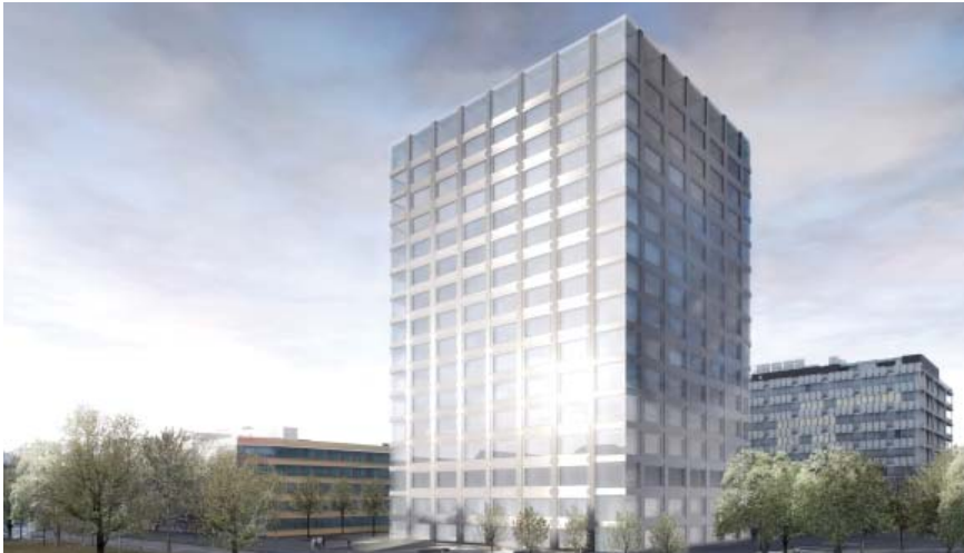
Le Biozentrum de l'Université de Bâle, dont la construction sera achevée en 2018, est le dernier grand projet de construction que la Confédération soutient sous l'ancienne législation.

Entre 1970 et 2016, la Confédération a subventionné des projets d'investissement des universités cantonales à hauteur de 4,75 milliards de francs. Ces contributions fédérales ont servi à l'achat, la construction et la transformation de bâtiments ainsi qu'à l'acquisition et l'installation d'appareils scientifiques et d'équipements informatiques. Depuis le début de l'année, ces contributions sont versées conformément à la loi sur l'encouragement et la coordination des hautes écoles.